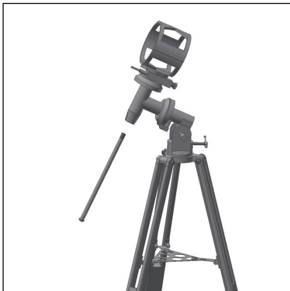
Fig. 6. Fixation de la barre de contreponds.