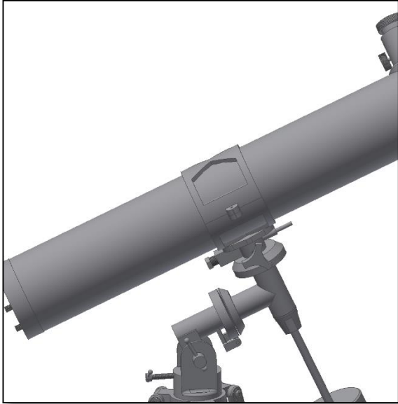
Fig. 8. Fixation du tube.