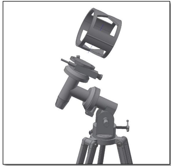
Fig. 5. Montage et serrage des colliers.