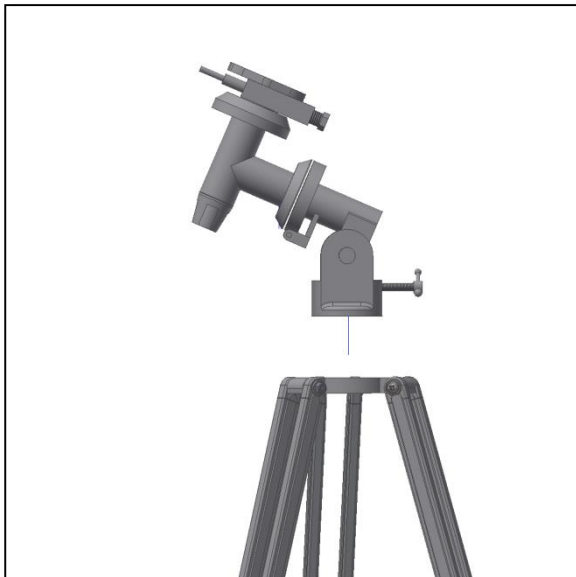
Fig. 4. Mise en place de la monture équatoriale.