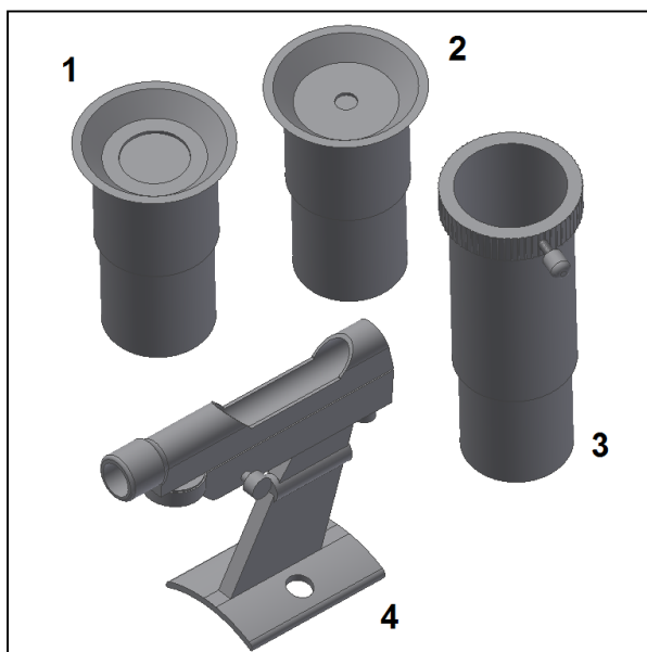
Fig. 1. Livraison.

2. Pour commencer. Il est très facile de trouver les premiers objets avec le télescope. Fonctionnement du télescope : L'ouverture de l'objectif du télescope doit être pointée sur l'objet que vous voulez regarder. Le grand miroir sur le côté opposé à l'intérieur du tube, collecte la lumière provenant de l'objet, la reflète sur le petit miroir secondaire qui la dirige vers l'oculaire. A proximité de l'ouverture du télescope se trouve le système de mise au point. Il se déplace vers le haut ou vers le bas et permet de rendre l'image nette. Les accessoires inclus peuvent se monter directement sur le système de mise au point. Différentes combinaisons d'accessoires produisent des résultats différents, par exemple, des changements de grossissements.