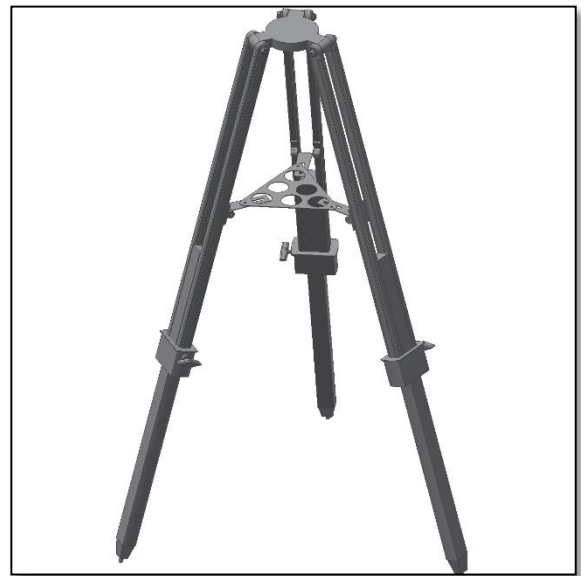
Fig. 3. Fixation du plateau.