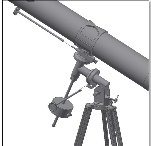
Fig. 9. Boutons pour effectuer des mouvements fins.