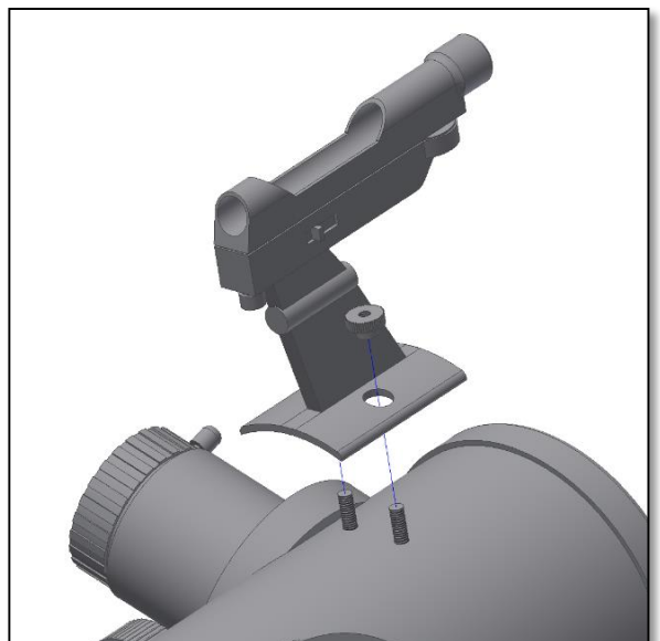
Fig. 11. Fixation du chercheur avec les écrous