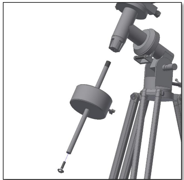
Fig. 7. Montage du contreponds.