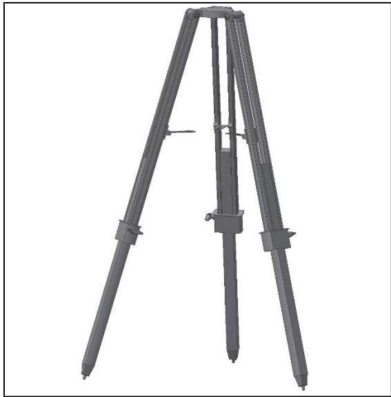
Fig. 2. Préparation du trépied.